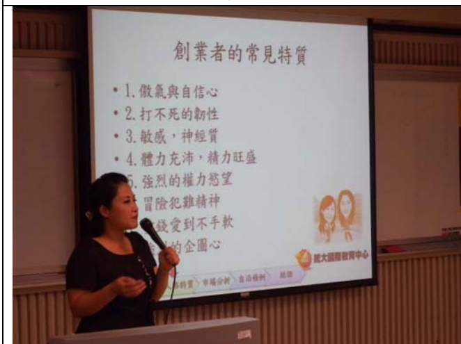
講者分享創業者的常見8個特質