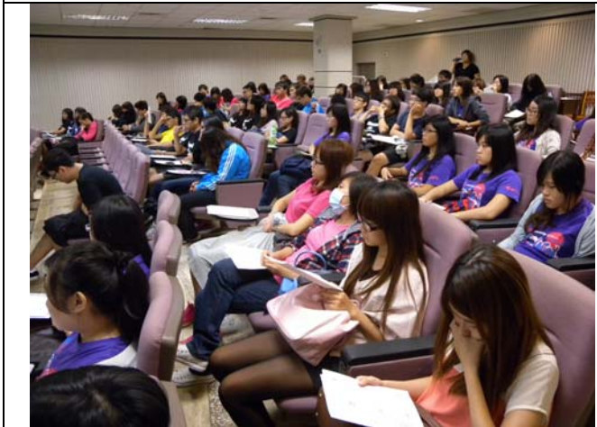
座無虛席專心聽講