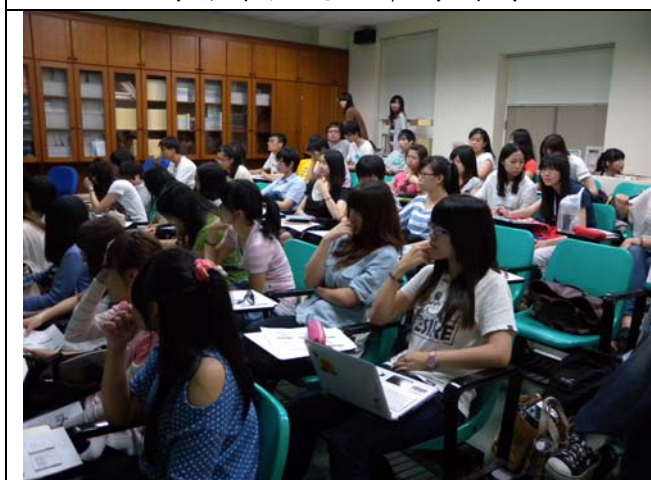
座無虛席專心聽講