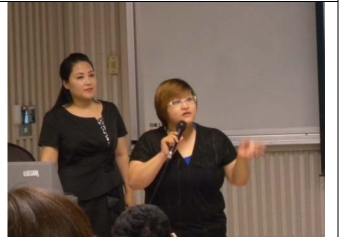
總經理帶來另位助教分享實務經驗