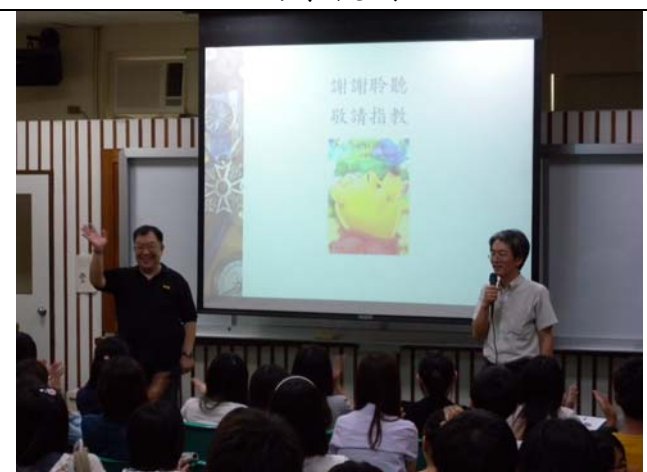
姜添輝老師閉幕結語向講者與學員致謝