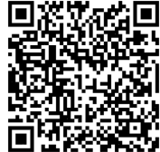
第二階段 繳費報名